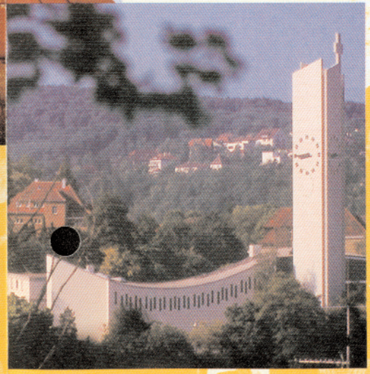
Katholische Kirche St. Konrad

Das besondere Programm des gemeinsamen Singens entwickelte bald eine große Anziehungskraft. Der Chor gewann durch Qualität und Programmauswahl seine Mitglieder nicht nur aus den Trägergemeinden, sondern auch über die Gemeindegrenzen hinaus, eine Entwicklung, die bis zum heutigen Tag anhält. Der Ökumenische Chor der Christus- und St.-Konrad-Kirche zählt zur